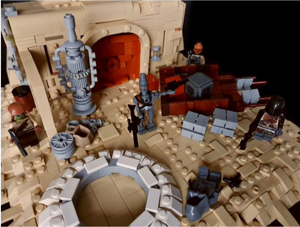
Star Wars THE